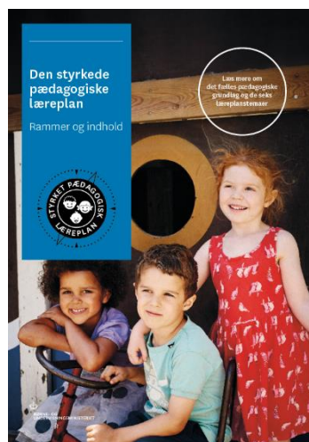
Den styrkede pædagogiske læreplan, Rammer og indhold

Inden for de krav, der følger af dagtilbudsloven, er det op til jer at beslutte, hvordan I konkret vil arbejde med den pædagogiske læreplan. Jeres læreplan skal være et dynamisk og meningsfuldt dokument, som peger fremad, og som I kan bruge aktivt i den løbende udvikling af den pædagogiske kvalitet og jeres pædagogiske praksis.